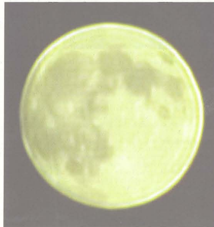
Super-résolution de la Lune. En agrandissant une image prise avec un appareil numérique standard, celle-ci devient floue. En y ajoutant des algorithmes de l'EPFL et de l'Imperial College, la Lune (à droite) devient nette avec le même agrandissement en utilisant plusieurs images floues.